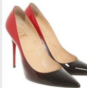
Christian Louboutin - Décolleté/Spunta verniciata